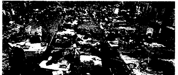
O Rio Grande do Sul contabiliza, até o momento, 722 abrigos temporários, montados em decorrência das fortes chuvas, inundações e enxurradas

O prefeito de Canoas, no Rio Grande do Sul, Jairo Jorge (PSD), pediu na tarde desse domingo (12/05), que os moradores que começaram a retornar para as suas casas que saiam novamente os imóveis com urgência. O pedido foi feito por meio de um vídeo publicado nas redes sociais. Na publicação, o prefeito explica que as chuvas intensas que caíram nas últimas horas podem provocar uma elevação de 5,5 metros no nível dos rios, o que pode provocar um momento ainda mais tenso em razão da chuva que está caindo sobre o vale do Rio Jacuí, vale Taquari, vale do Rio Cai, Rio dos Sinos e Rio Gravataí. "Todas essas águas começam a desembocar aqui em Canoas", avisa Jairo Jorge. "Vamos dar aqui um alerta de evacuação imediata. Eu peço a todos os canoenses que voltaram às suas casas, para o lado oeste (bairros Rio Branco, Pitima, Mato Grande, Harmonia, Matias e São Luís), que saiam imediatamente, porque as águas retornarão. E se a pessoa ficar, ela, possivelmente terá que ser resgatada", afirmou o prefeito.