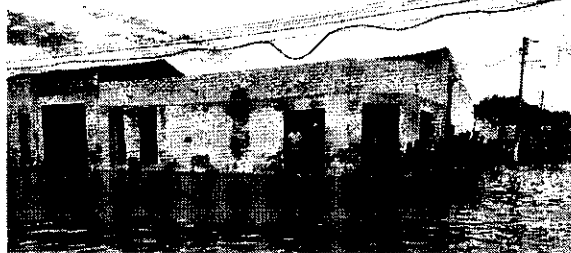
A previsão da Funceme indica que os acumulados de chuva devem diminuir entre hoje e amanhã

Nesta segunda-feira, 10, a Prefeitura do município de Farias Brito, localizado a aproximadamente 472 km de Fortaleza, lançou uma campanha para arrecadar alimentos, produtos de higiene pessoal, água e roupas para as famílias que foram afetadas pela enchente que atingiu a cidade no último domingo, 09. As doações estão sendo recebidas na Secretaria de Assistência Social, no prédio da gestão, que fica no Centro da cidade. "Sua contribuição fará a diferença na vida de muitas pessoas", escreveu a Prefeitura em um comunicado publicado nas redes sociais.