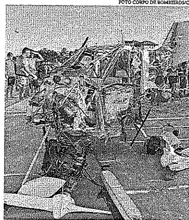
No mais recente, um médico de 74 anos que pilotava a aeronave, que caiu no mar, morreu mesmo após receber atendimento

Sobre os acidentes, o piloto avalia que o ideal é que não ocorram, mas con-