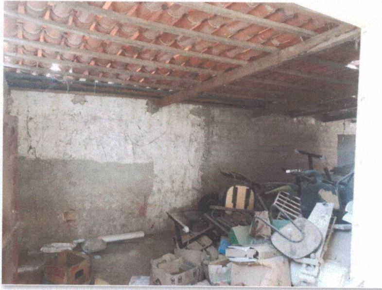
Figura 9: Quintal