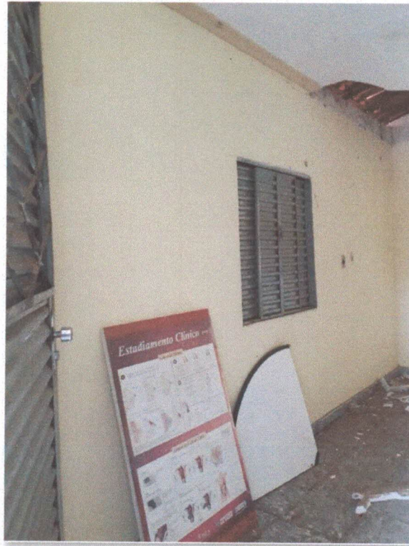
Figura 7: Sala de estar