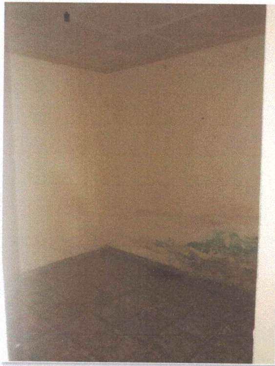
Figura 5: Quarto 1