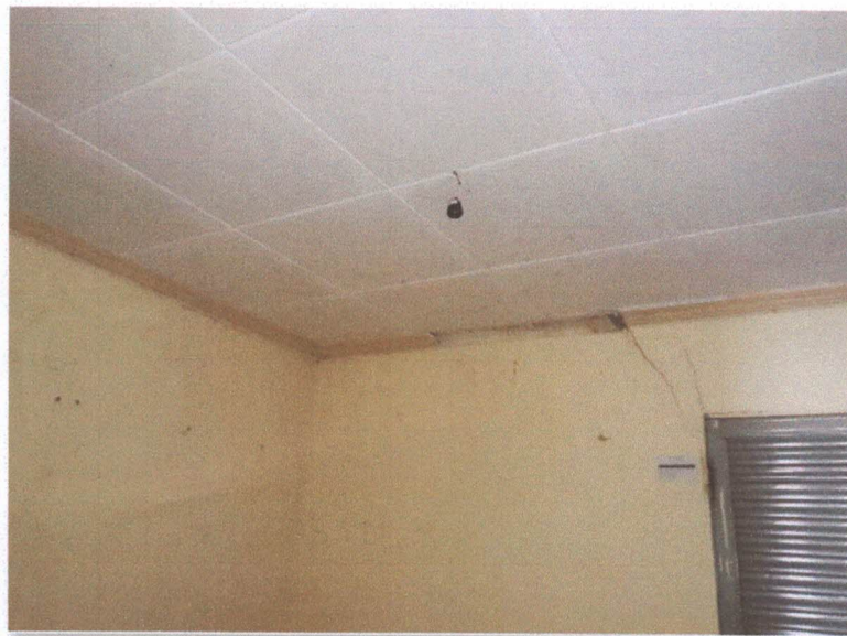
Figura 4: Quarto 1