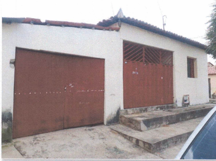
Figura 1: Fachada do imóvel.

Segue abaixo as fotos do imóvel situado à Rua São Sebastião, 78, Cj. Ana Loiola de Alencar Salatiel, Bairro: Centro – Araripe CE.