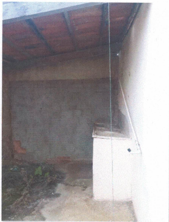
Figura Figura 8: Quintal