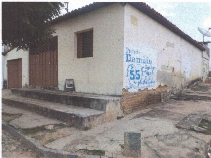
Figura 2: Fachada Lateral