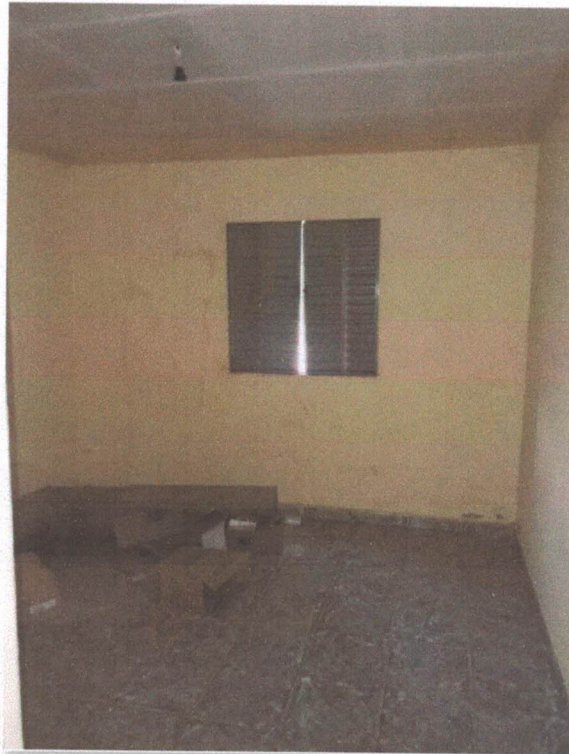
Figura 6: Quarto 2