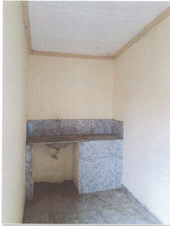
Figura 3: Cozinha