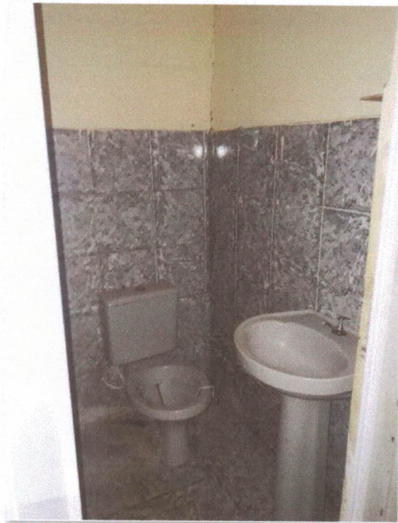
Figura 10: Banheiro