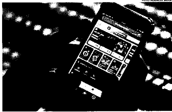
As apostas esportivas já são legalizadas, mas carecem de regulamentação adequada

A taxação das apostas também destinará recursos para diversas áreas. Os valores arrecadados serão direcionados para segurança pública, educação básica, clubes