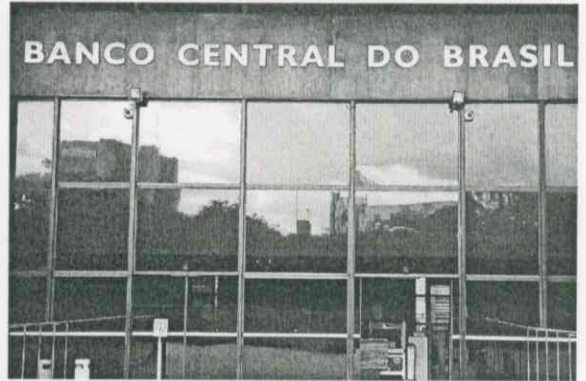
Em levantamento feito pela Bloomberg, todos os economistas consultados projetavam a elevação da Selic

semana, no qual o BC divulga as projeções do mercado, mesmo após a alta nos juros, os economistas continuaram elevando as expectativas de inflação para 2021, que estão em 5,82%, 0,57 ponto percentual acima do máximo permitido pelo CMN (Conselho Monetário Nacional).